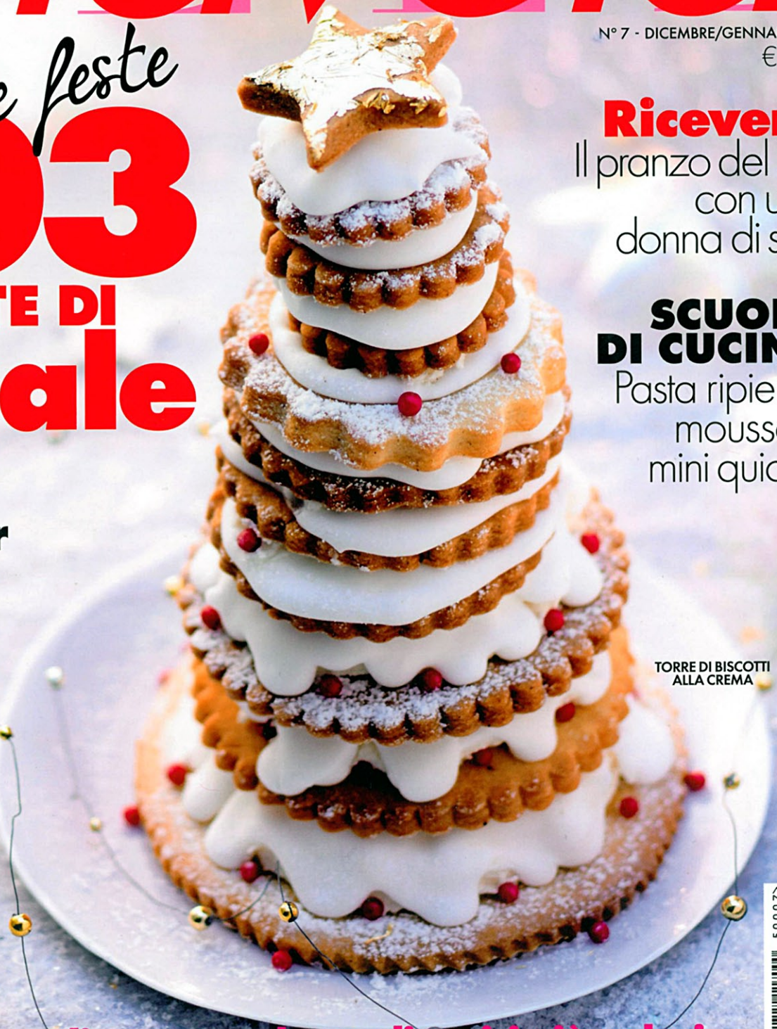
TORRE DI BISCUITI ALLA CREMA

Piatti stellati facili e di gran successo