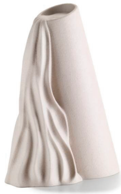
Acquario di Lineasette appartiene alla linea Segni Celesti ed è una scultura che misura 12x18x26 h cm.

Come dicevo poco fa, i nostri prodotti sono oggetti 'relazionali' e, in quanto tali, per essere riconosciuti, oltre ad avere una poetica propria, ovvero essere il risultato di un'ispirazione autentica, devono essere sostenuti e presentati con una complessa, ma coerente strategia testuale, che va dai contenuti del sito, allo stile espositivo nei padiglioni della fiera, capace di sviluppare un legame emozionale tra forma e funzione dell'oggetto, che nel nostro caso è il suo valore poetico.