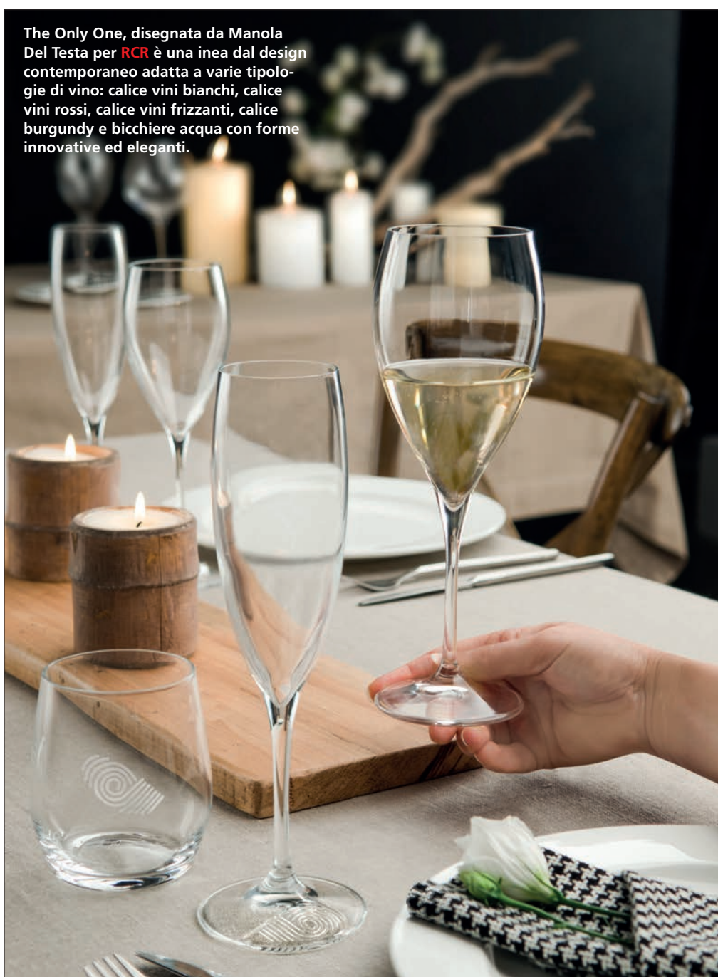
The Only One, disegnata da Manola Del Testa per RCR è una linea dal design contemporaneo adatta a varie tipologie di vino: calice vini bianchi, calice vini rossi, calice vini frizzanti, calice burgundy e bicchiere acqua con forme innovative ed eleganti.

L'Italia gioca ancora un ruolo da top player nell'orientamento alla spesa dei big spender cinesi, che percepiscono il prodotto italiano non solo come oggetto d'eccellenza in qualità e design, ma anche come simbolo di un insieme di valori tradizionali senza uguali nel resto del mondo. Ad affascinare il pubblico cinese è soprattutto il concetto di stile di vita italiano, veicolato attraverso i diversi tipi di prodotto, dagli strumenti di cucina ai mobili, alla decorazione della casa. Il colore torna a caratterizzare spazi, oggetti e ambienti del vivere quotidiano, con cromie accese e decise: gli espositori del settore cucina hanno stupito i visitatori con soluzioni sostenibili pensate in primis per la salute del cliente finale, sempre più attente a rendere moderna l'esperienza del vivere questo spazio non solo in modo più funzionale, ma anche con una sua personalità, con strumenti sempre più sofisticati e ricercati. Gli utensili tradizionali dedicati alla preparazione del cibo, come pentole e coltelli, si presentano rinnovati grazie alle nuove tecnologie applicate, ben rappresentate nell'area Negoziò Incontro che ha richiamato molti visitatori grazie ai momenti di intrattenimento, informazione e formazione: dai workshop organizzati con Retail-In, agli